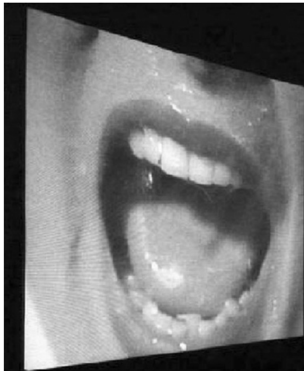
Fig 3 Douglas Gordon, “24 Hours Psycho”, 1993.

O abrandamento e a ausência de som elimina o medo e o suspense, modificando consideravelmente a nossa percepção do filme e direcciona a atenção do fruidor para as imagens que se sucedem uma após outra. Gordon recusa qualquer expressão pessoal 7 , e reenviando o espectador para uma experiência e um contexto individual, advoga um espectáculo-experiência. Assim, o que se revela de maior importância não é tanto quem é o autor da obra, mas sim a definição de um sentido para a mesma. Ele radicaliza a imagem e joga com a gramática visual. Apoiando-se sobre a familiaridade das sequências que extrai do seu contexto, ele desloca a atenção do espectador da acção sobre a estrutura interna das imagens. Tal como Huyghe, Gordon também evoca a importância do papel da memória. A obra “Psychose” é reactualizada no fruidor que já o conhece e portanto, quem viu o filme pode antecipar o que se passa. Dando o mesmo sentido intertextual a “24 Hours Psycho”, Gordon não procura destruir o filme, mas sim provocar uma nova leitura comparada com o original.