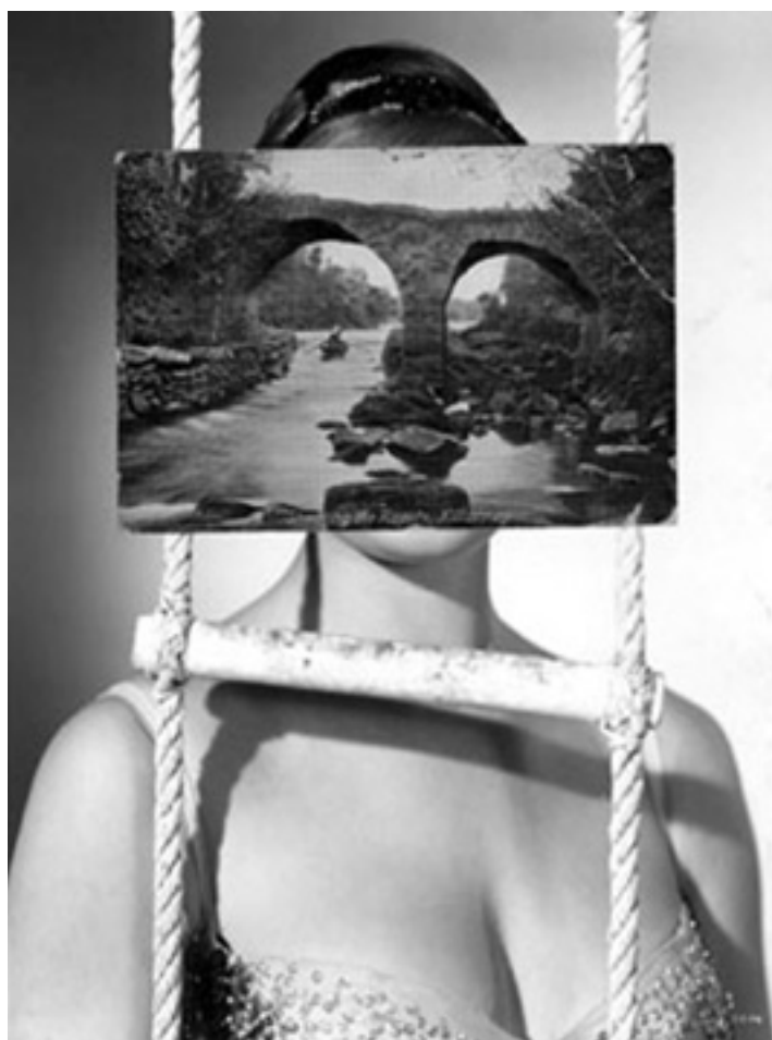
Fig 5 Mask XV, 1982.

Perante a obra de Stezaker deixamo-nos levar quer pelo surrealismo das imagens criadas, pela beleza da paisagem, pela beleza perdida das caras das personagens, quer ainda pela beleza cirúrgica que a obra final ostenta. John Stezaker repara, transforma e embeleza. Ele dá uma segunda vida às imagens e encaminha-nos para um universo próximo da quarta dimensão.