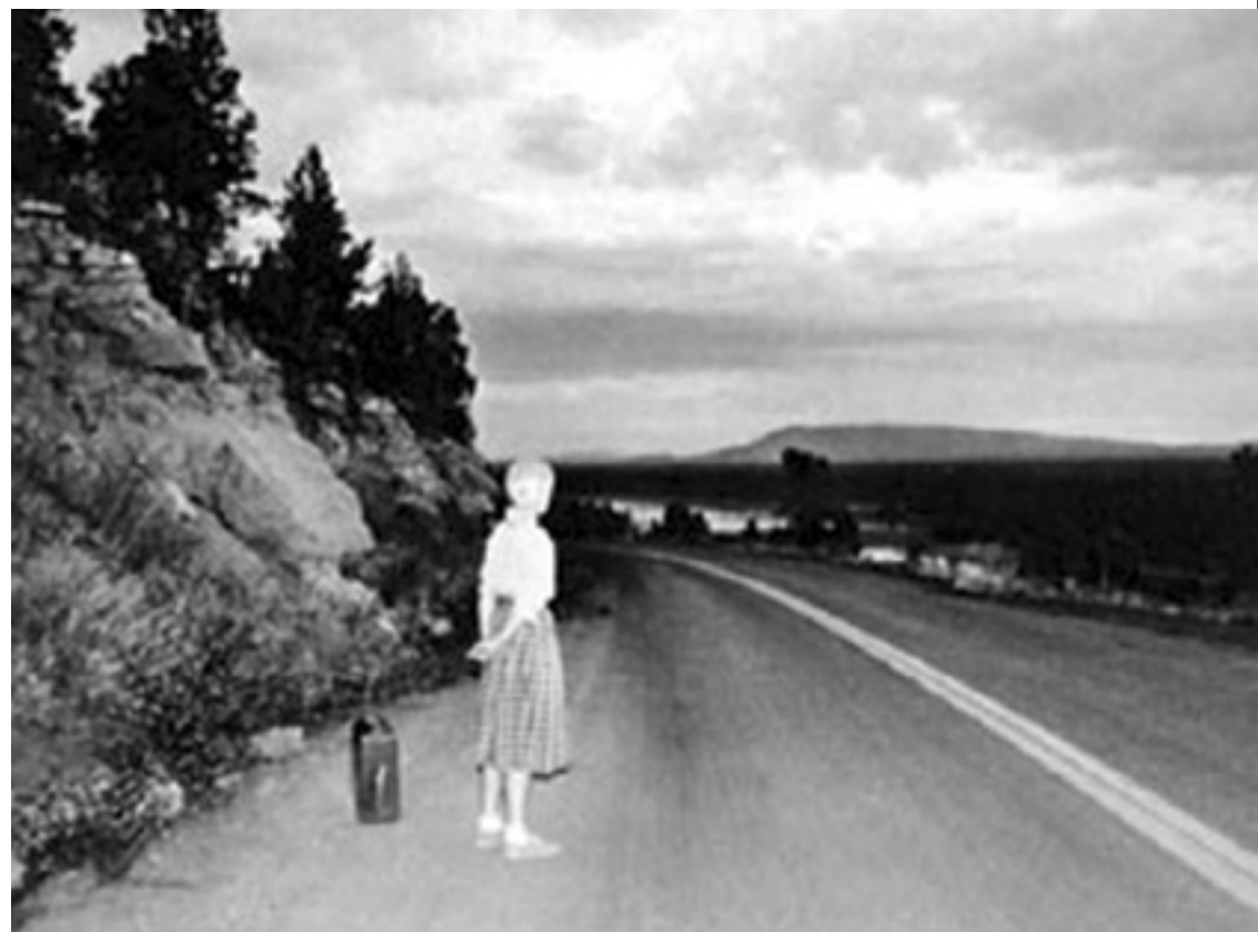
Fig 1 Cindy Sherman, “Untitled Film Still #48”, 1979.

Na obra “Untitled Film Still #48” (Figura 1) vemos Cindy Sherman vestida como uma adolescente dos anos 70 em pé, à borda de uma estrada. A sua mala pode significar que tenta escapar do seu lar. Ela evidencia uma situação perigosa, pois não estamos na posse dos restantes acontecimentos. A perigosidade de uma boleia ou um cenário de atropelamento, é uma construção que realça um drama em potência. Substituindo a actriz, Sherman fala-nos da sociedade estado-unidense em que vive. Sob a capa de uma nova personagem ela esconde-se para se revelar de outra forma. Contrariamente a Orlan (1947- ) que trabalha sobre o estatuto do corpo na nossa sociedade contemporânea, programando a sua própria mutação, mudando de corpo e de imagem através de operações cirúrgicas, Sherman produz uma mutação visível, mas que apenas pode ser compreendida por quem tenha a capacidade de se olhar no espelho imaginário que nos apresenta e a sensibilidade de se reconhecer nele próprio.