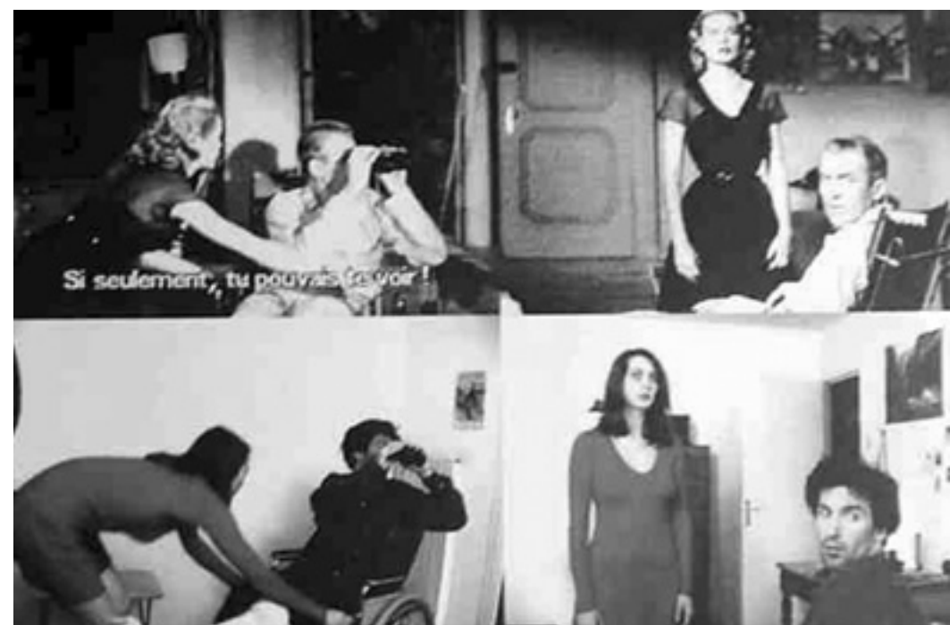
Fig 2 Pierre Huyghe, “Remake”, 1995.

“Ellipse” opera uma descondensação do tempo diegético, a activação de um tempo sugerido e não vivido. Huyghe trabalha sobre o efeito que produz sobre o fruidor, o diferido ou a diferença entre as situações que misturam ficção e realidade e por conseguinte, realçando a ideia de que a memória tem como característica, o atraso.