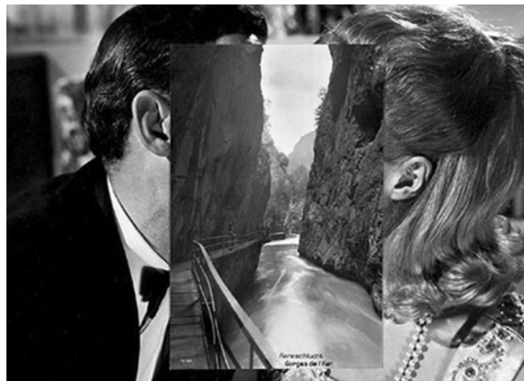
Fig 4 John Stezaker, “Pair”, 2007.

A colagem em Stezaker não pretende procurar um espaço comum, mas pelo contrário trabalha uma certa heterogeneidade. Ele expõe as “cicatrices”, sem se preocupar com o facto do processo de criação se tornar evidente. Os defeitos tornam-se efeitos. É precisamente neste desvendar do processo que reside o interesse da obra de Stezaker. O limite entre duas imagens organiza um espaço que ressalta para qualquer fruidor, constituindo-se por isso, um espaço em si. A fruição é portanto demorada na análise da incoerência das imagens, e nas “ruínas” que se revelam nesses limites.