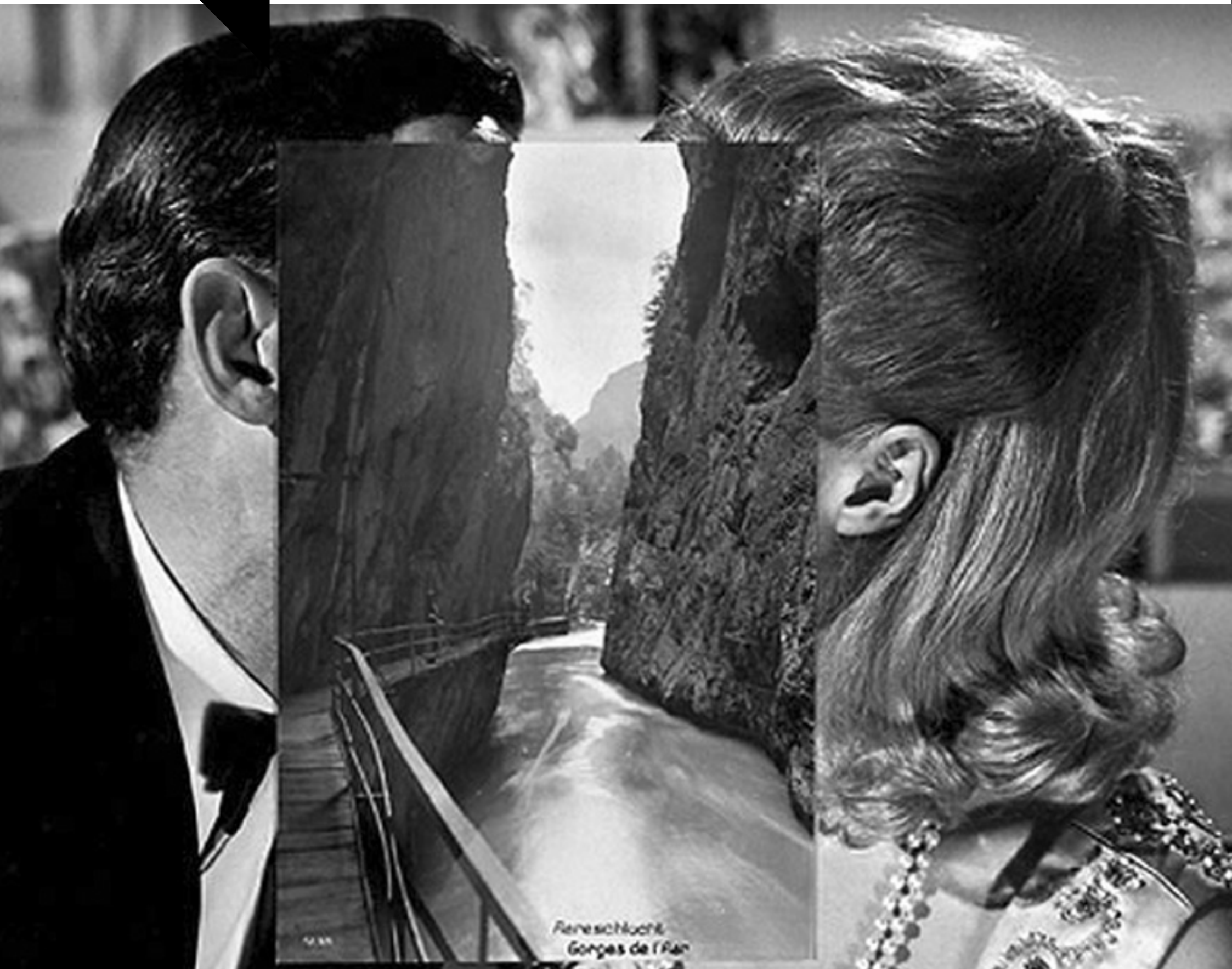
Arenschlucht, Gorges de l'An